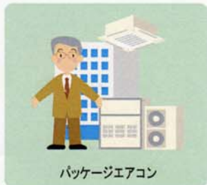
パッケージエアコン

コンデンシングユニット、冷凍・冷蔵庫、冷凍・冷蔵ショーケース、冷凍・冷蔵装置、ヒートポンプ給湯機など