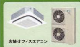
店舗・オフィスエアコン