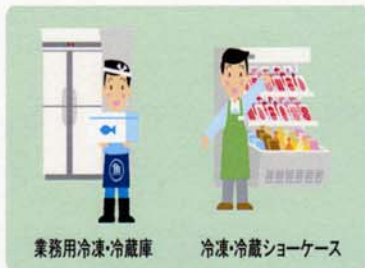
業務用冷凍・冷蔵庫