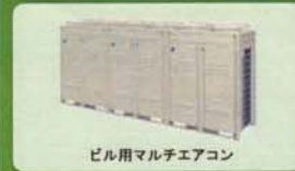
ビル用マルチエアコン